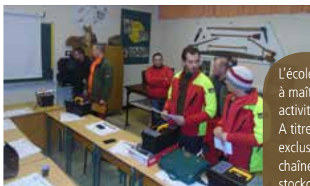
La salle de cours à Saverne

La partie théorique de la formation se déroule dans les locaux du Lycée professionnel Jules Verne à Saverne (67). Les stagiaires disposent d'une salle de cours, d'un atelier de nettoyage, d'établis ainsi qu'un local de stockage du matériel.