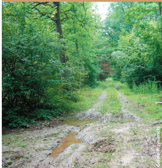
“Nids de poules” sur le chemin forestier endommagé par la circulation et par les intempéries.