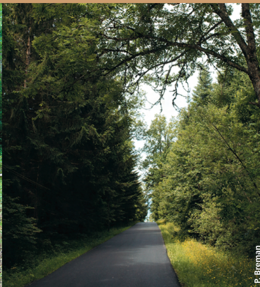
Chaussée revêtue : la solution pour les routes très fréquentées.