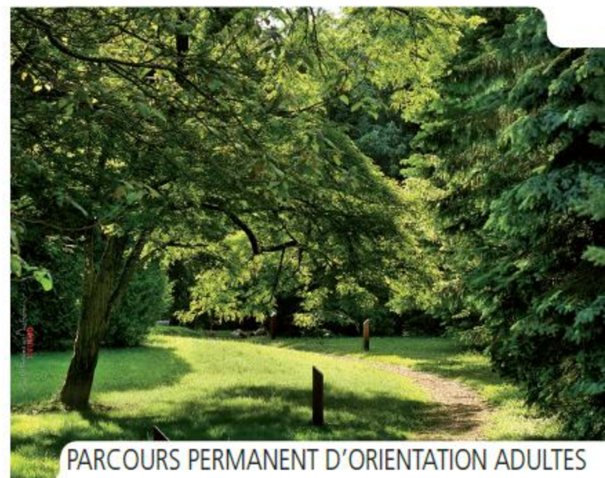
PARCOURS PERMANENT D'ORIENTATION ADULTES