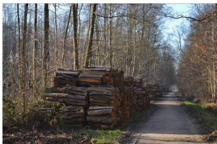
Le bois est entreposé en bord de chemin

Celui-ci sera utilisé en bois de chauffage.