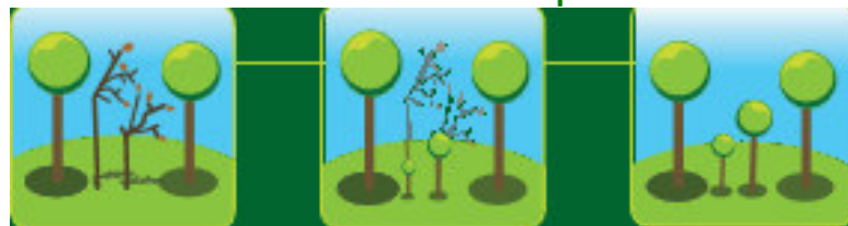
Des arbres dépérissants