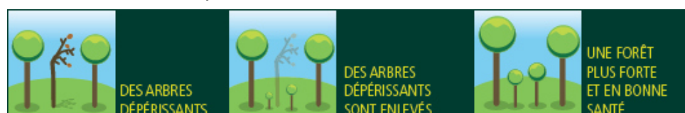
Illustration d'une coupe sanitaire

Parallèlement, cette coupe vise à sécuriser la lisière nord qui concerne les propriétés riveraines des rues de « Bièvres » et du « Sud » : un abattage sera réalisé systématiquement concernant les arbres pouvant menacer les bâtiments en cas de chute.