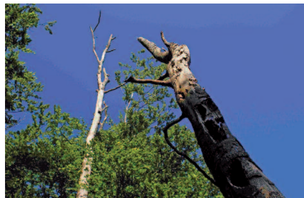
Réalisation et Impression : ONF - Fontainebleau octobre 2009

La forêt reste ouverte au public. Mais plus que jamais la charte du promeneur figurant sur les panneaux d'information doit être respectée (interdiction de ramassage du bois mort, circulation sur les chemins...).