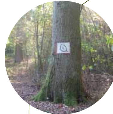
Identification d'îlots de sénescence en forêt : ces petites zones soustraites à l'exploitation sont très favorables à la biodiversité