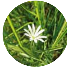
Stellaire des marais

Le DOCOB préconise le maintien, voire la restauration de ces milieux remarquables et de leur caractère inondable ou humide. Pour cela, une gestion annuelle adaptée est indispensable.