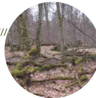
Bois mort en forêt du Bienwald

Celui-ci est constitué d'un vaste massif forestier de 12 000 ha entièrement géré par le Forstamt (administration forestière allemande). Un vaste projet de protection du site allemand est mis en œuvre ; s'appuyant sur de nombreuses études et expérimentations concernant les habitats forestiers et les milieux ouverts et de lisière.