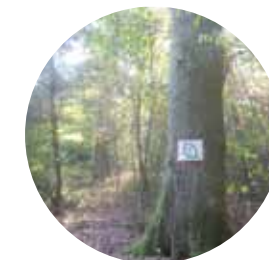
Mise en place d'un îlot de sénescence