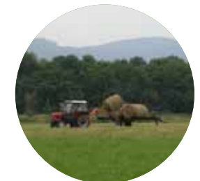
Fauche de prairie