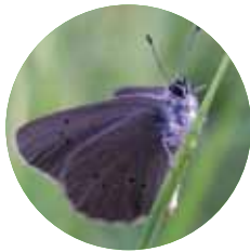
Azuré des Paluds

2 Les Milieux Ouverts : composés majoritairement de prairies humides et de marais, ils sont présents par petites touches d'un bout à l'autre du site, offrant une diversité de milieux propice au développement d'une importante biodiversité. Autrefois largement répandus sur les bords de la Lauter et dans le marais d'Altenstadt, ces milieux sont aujourd'hui menacés par la diminution de l'élevage.