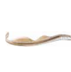
Lamproie de Planer