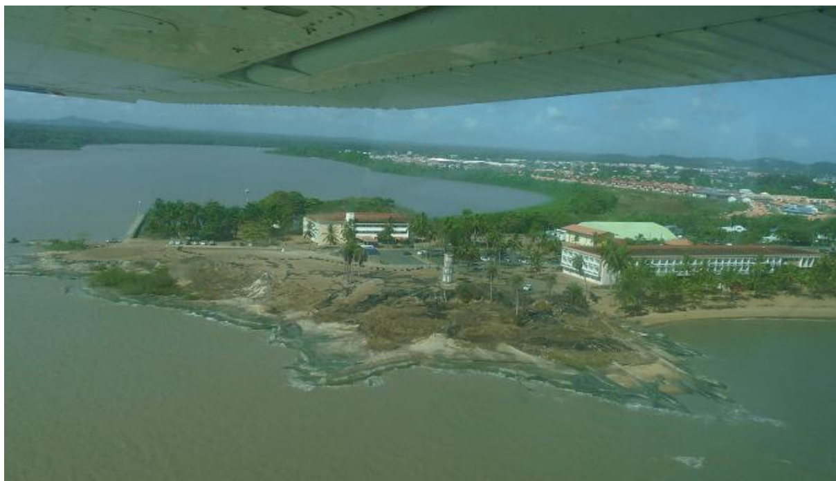
Survol de la Pointe de roches à Kourou

En février nous n'avons pu réaliser les comptages jusqu'au bout de la zone d'étude (zone 6 à 8) probablement à cause de la puissance des marées et des vents. Effectivement, arrivés sur ces zones les vasières étaient déjà recouvertes.