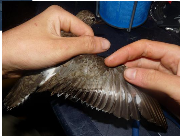
Prélèvement de sang sur un Bécasseau semipalmé ( Calidris pusilla ) et prélèvement de plumes sur un Chevalier grivelé ( Actitis macularia ).