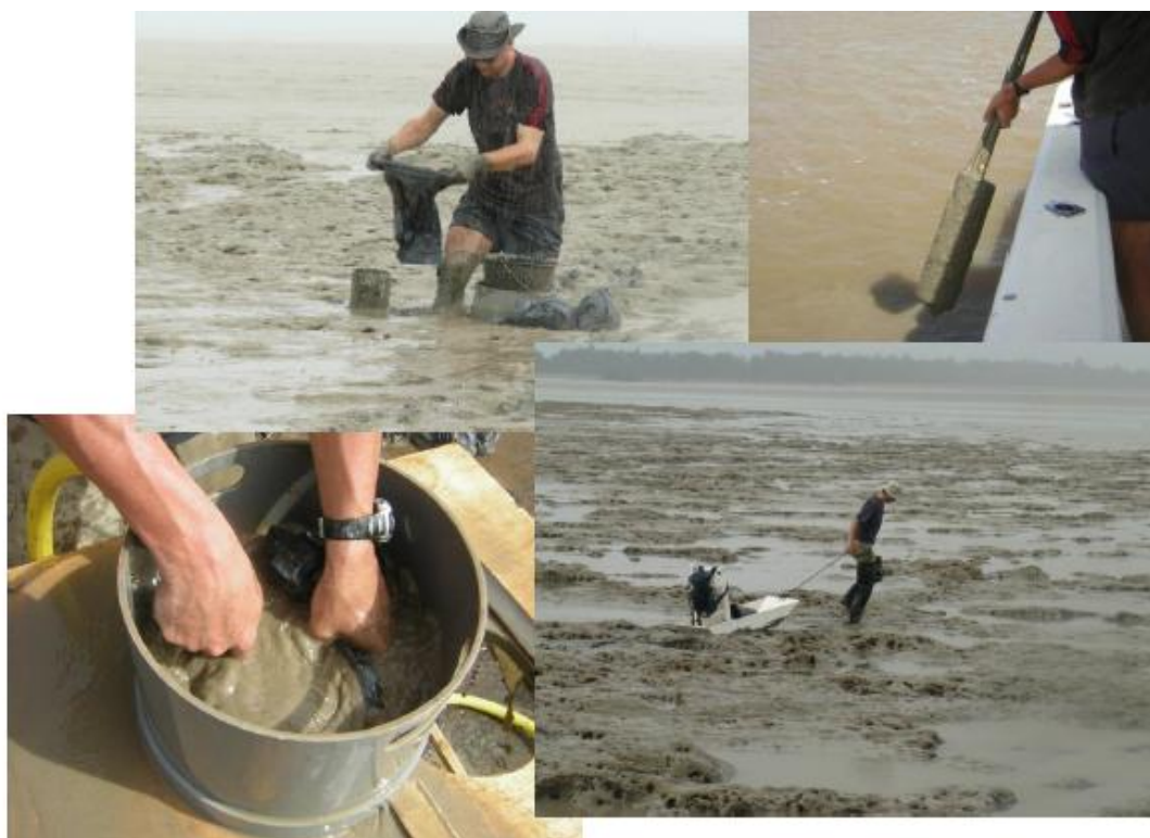
Echantillonnage en Janvier/Février sur le littoral guyanais avec l'Université de La Rochelle

L'ensemble des échantillons récoltés entre Octobre et Avril seront traités et analysés à La Rochelle en Mai 2011 (avec ceux récoltés précédemment depuis le début du programme).