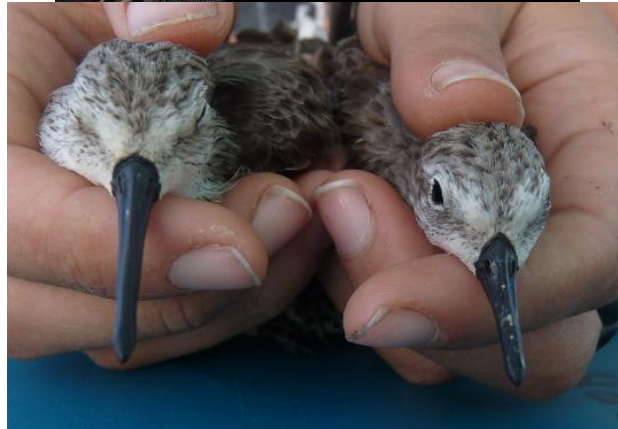
Baguage d'un Bécasseau semipalmé avec la NJAS.

Tourne-pierre à collier ( Arenaria interpres ) et différence de bec entre le Bécasseau d'Alaska ( Calidris mauri ) et le Bécasseau semipalmé ( Calidris pusilla ). (M. Laguna)